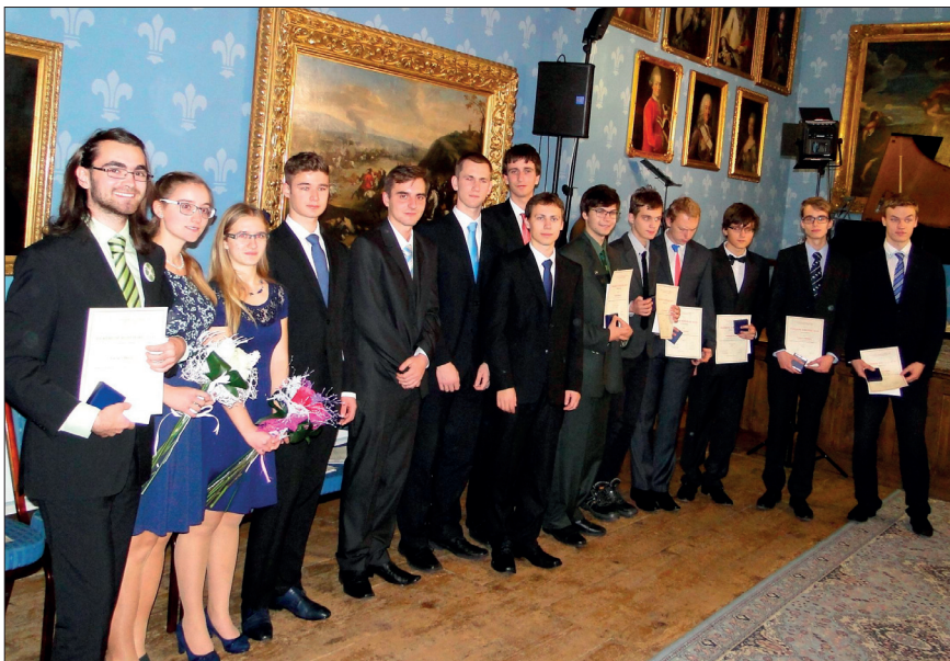
Studenti ocenění PRAEMIUM BOHEMIAE 2016 (s. 119).