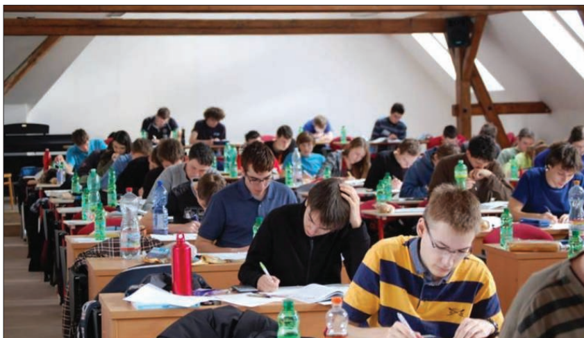
Celostátní kolo Fyzikální olympiády 2014. Řešení teoretických úloh v aule gymnázia Ladislava Jaroše v Holešově. (s. 235)