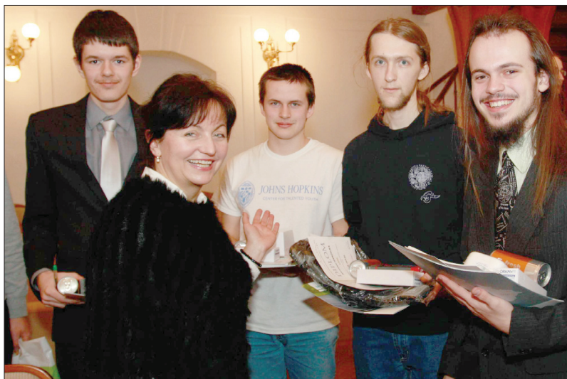
Celostátní kolo 54. ročníku Fyzikální olympiády (viz s. 230)

ČASOPIS PRO VÝUKU NA ZÁKLADNÍCH A STŘEDNÍCH ŠKOLÁCH