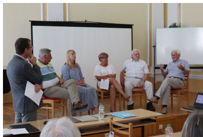
Kulatý stůl na téma vzdělání a dnešek